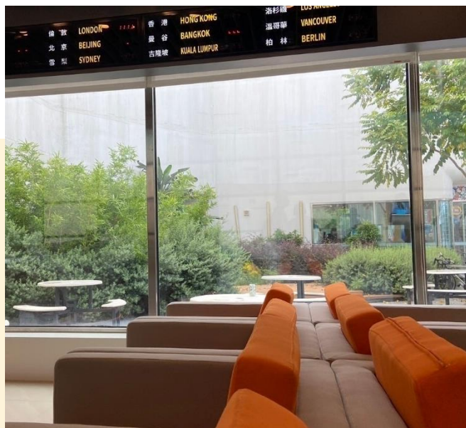
遊客中心外牆與內部