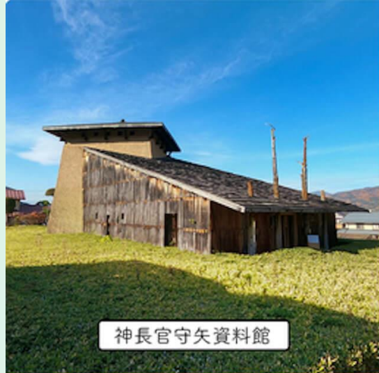
神長官守矢資料館