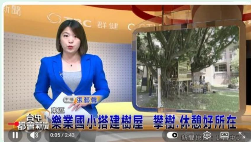
TBC台中生活台新聞畫面：樂業國小樹屋完工報導

國語日報 ( 2025/9/12 ) 報導：「我的祕密基地 中市樂業小木工造樹屋」，記者張彩鳳採訪報導，廣泛傳播計畫理念。