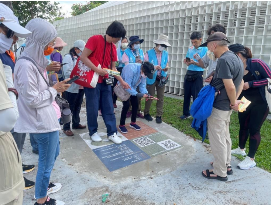
中央公園志工搶先體驗《我在水滸的故事》AR公共藝術

為了讓中央公園的志工能認識作品，特別由藝術家帶領志工搶先體驗。志工們手持手機，跟著畫面指引在公園中探索—有人踏入「過去」，走進飛機聲轟鳴的年代；有人停留在「現在」，看著草地上孩子們奔跑嬉戲；也有人點開「未來」，展望這片土地的新生想像。三個時空交錯並存，現實場景與虛擬場景相互疊合，讓民眾如同穿越時空的旅人。這樣的體驗不僅拉近了人與土地的距離，也讓每個人以自己的步伐，在水滸找回一段共感的記憶與想像。