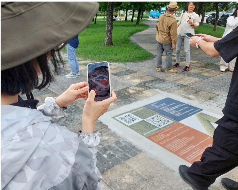
委員體驗丙案作品操作

公共藝術《我在水滸的故事》由藝術家挑選中央公園及附近區段徵收小公園共 8 個設置點，透過地磚導覽說明牌，民眾只需以手機或其他行動裝置掃描【AR互動藝術】QR code，即可從「過去」、「現在」與「未來」三個視角，進入三段式互動敘事體驗。彷彿一扇扇時光之門在眼前打開，讓觀者在現實場域中穿梭虛擬歷史，親身感受水滸從機場到都市綠洲的轉變歷程。