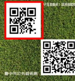
臺中市公共藝術網

Title of work: My Story in Shunhai No. 1 Artist: Yao Yulin Year of work: 2025 Material: AR Digital Imaging, High Temperature Imaging Tiles Size: W120cm x L120cm