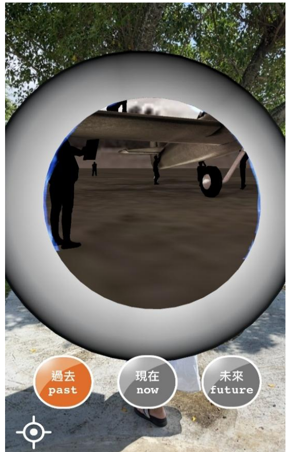
朝著時空門走入歷史