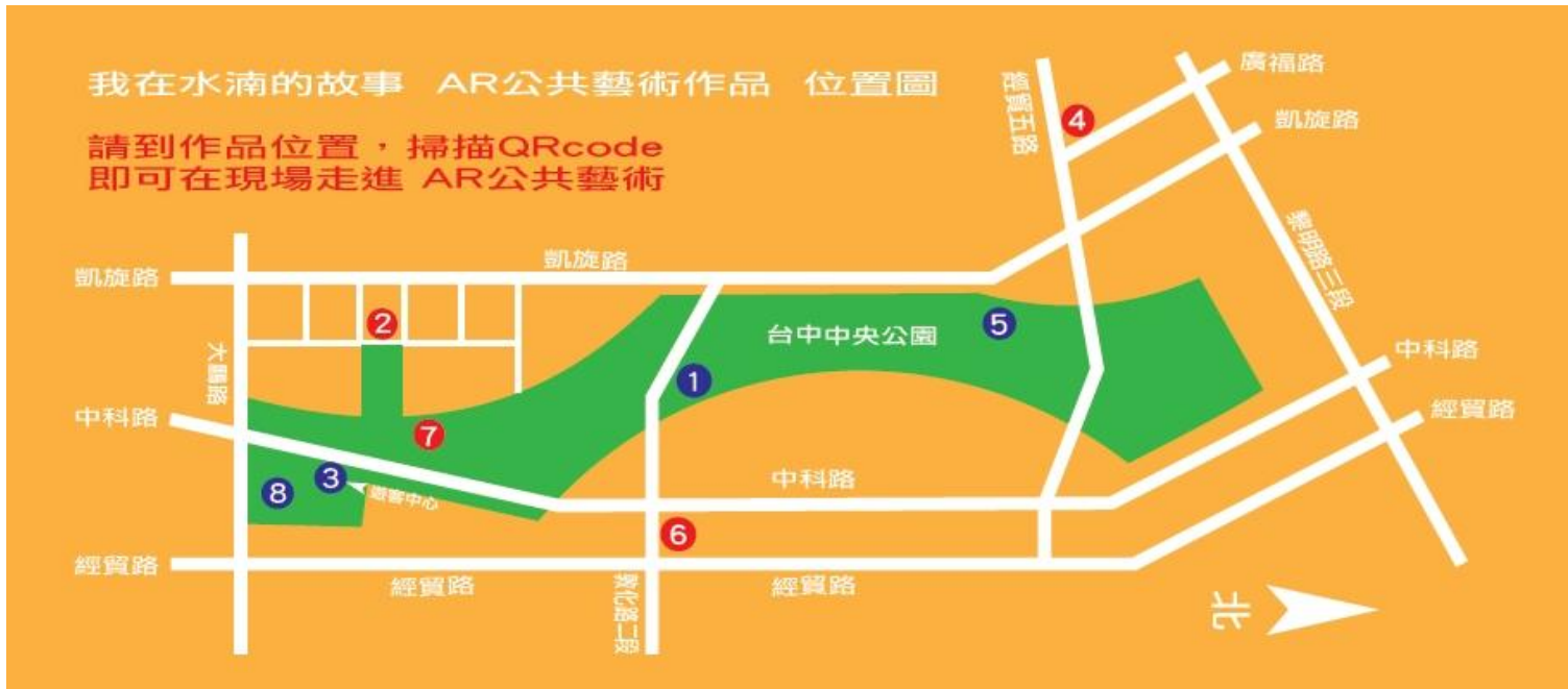
《我在水滸的故事》作品設置點