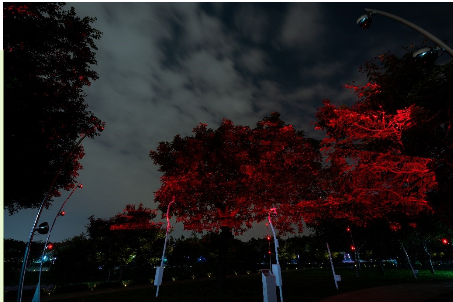
《座標系列-螢花》夜間

盧秀燕市長上任後積極打造幸福宜居的美學城市，在全市山、海、屯、城各區公共空間推動公共藝術設置，中央公園中更是設置了多件藝術作品，帶給民眾觀賞的趣味拉近民眾與藝術的距離，這些作品不僅讓藝術融合大眾的生活，亦與自然環境展現出共存共生的一面。