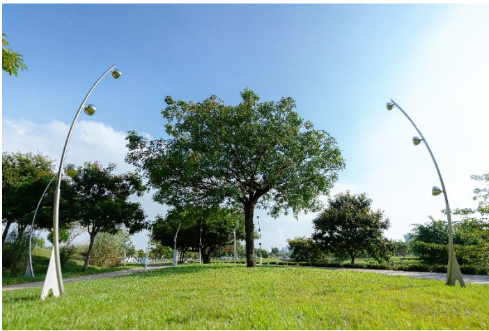
《座標系列-螢花》日間

藝術家透過燈光映照出大自然最特別的模樣，形成一幀非人工亦非自然的造景，彷彿會讓觀者進入了奇幻異世界之中，勾勒出虛擬世界中的奇幻想像，讓人有種穿梭時空的錯覺。