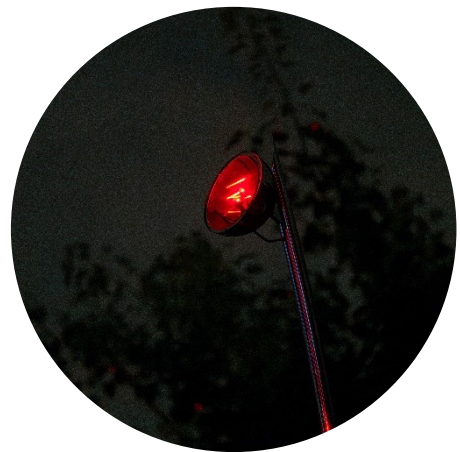
《座標系列-螢花》紅色雷射光

盧秀燕市長上任後積極打造幸福宜居的美學城市，在全市山、海、屯、城各區公共空間推動公共藝術設置，中央公園中更是設置了多件藝術作品，帶給民眾觀賞的趣味拉近民眾與藝術的距離，這些作品不僅讓藝術融合大眾的生活，亦與自然環境展現出共存共生的一面。