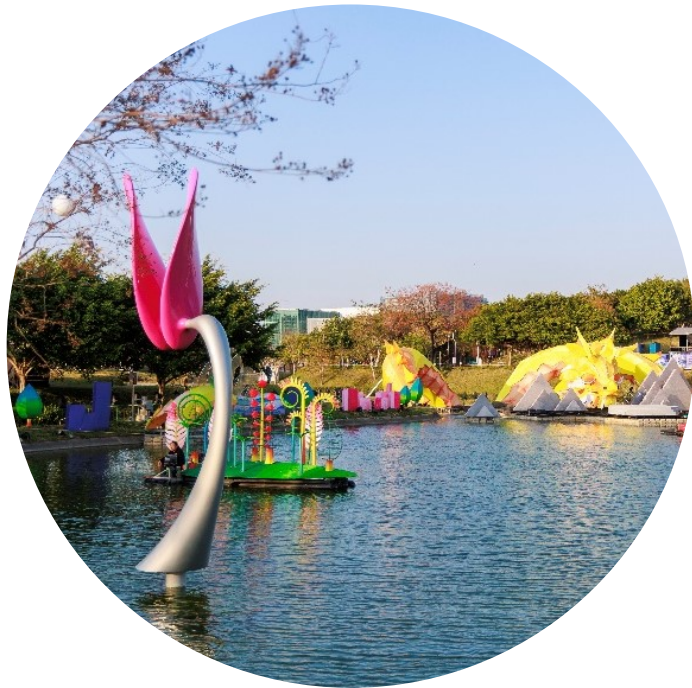
公共藝術作品《浮遊之花》

濕池區的花燈作品與公共藝術作品輝映下，展示效果非常精彩，園區內乾池區的作品也毫不遜色呦！在巨龍斜前方沿著藍色步道直走，是園區內最大的乾式滯洪池，經過去年的整理，現在已成為適合民眾散步遊憩的場域，此燈區由臺中市政府農業局規劃，花燈作品主要圍繞著自然環境及環保議題的，而藝術家李昀珊老師所創作的公共藝術作品《水滸種籽花園》，也變成該區的亮點之一，此件作品以「環境共生」為發想，藉由詩意的花朵與溼地對話，透過「花朵」與「種籽」的符號創造出一個生態小宇宙。