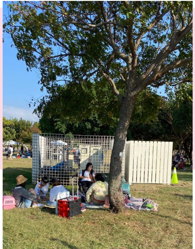
遊客於草地上野餐

甲案的公共藝術作品已經陸續設置完成，民眾倘佯在大自然中野餐的同時，也可以跟公共藝術作品更加親近。像是位於遊客中心旁的作品《雀鳥園藝師》，設置於寬敞的石頭步道旁，可以看到孩子們圍著作品觀察，好奇這些五彩繽紛的「大樹」它的功用是什麼。孩子們也會在這裡盡情奔跑，而家長們就在一旁愜意的野餐。這樣的輕鬆氛圍，為平日在都市叢林中奮鬥的民眾們，帶來大自然生機盎然的生命力。