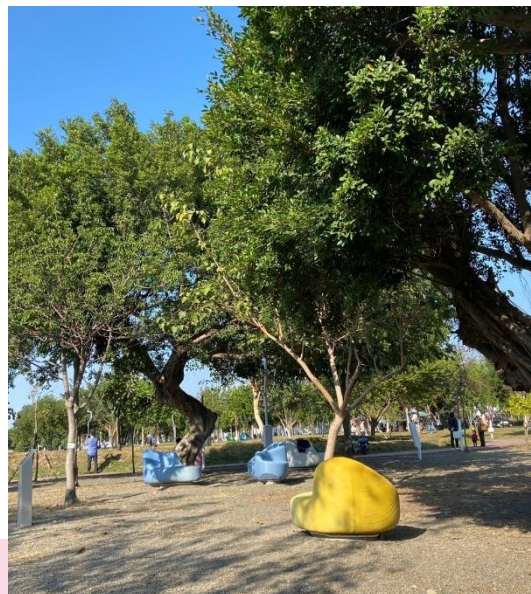
遊客於《水滄客廳·環生座椅》旁野餐

作品《水滄客廳·環生座椅》則是直接融入於市民的生活中。這件作品在大樹下營造出一個溫馨氛圍的空間，如它的名字一樣，真的成為中央公園裡的客廳，來往的民眾都成為中央公園的客人，來公園裡坐坐，無論是大朋友還是小朋友，都能在這裡找到一個舒適的休憩點，感受來自大自然的熱情招待。