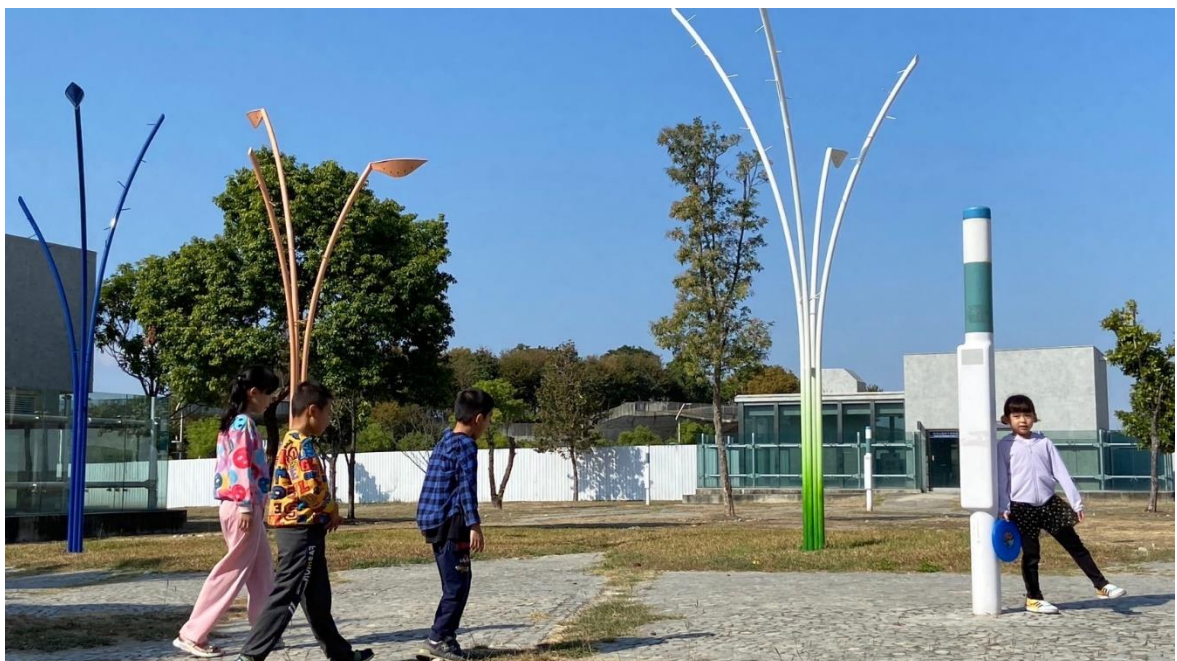
小朋友們於《雀鳥園藝師》旁玩耍