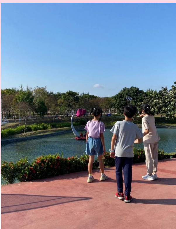
小朋友們驚奇的看著《浮游之花》

野餐日的活動規劃中，有一區分類為親子同遊區，親子同遊區緊鄰著滯洪池。當民眾經過滯洪池的時候，民眾們總會好奇地停下來看著佇立於水面上的巨大花朵，這朵花出自於紐西蘭藝術家Phil Price之手——作品名稱為《浮游之花》。當花瓣隨著風擺動時，路過的民眾們都會發出驚奇的喊聲，孩子們興奮地討論著：「這麼大的花瓣是怎麼動起來的呢？」